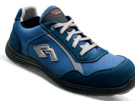
Kendji S3 SRC KENDS30BE