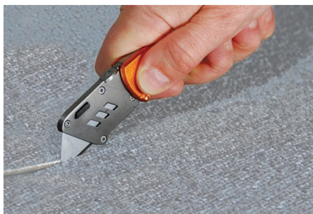
Mise en situation