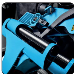
Tête avec coulissement radial