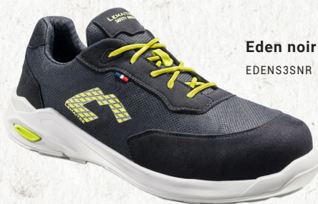
Eden noir S3S EDENS3SNR