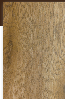
535 CHÊNE PRALIN *