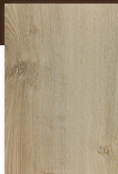
435 JEFFERSON *