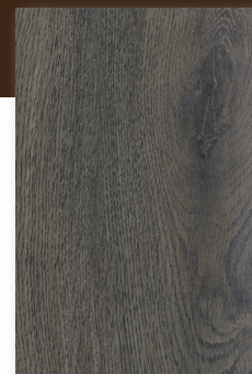
542 CHÊNE ARONIA *