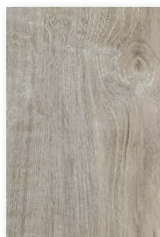
619 CHÊNE SARDAIGNE **