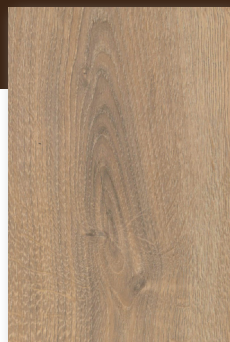
471 SUNSET *