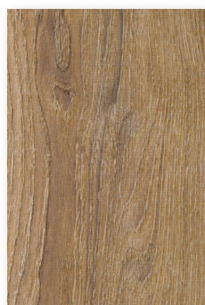
622 CHÊNE BALEARES **