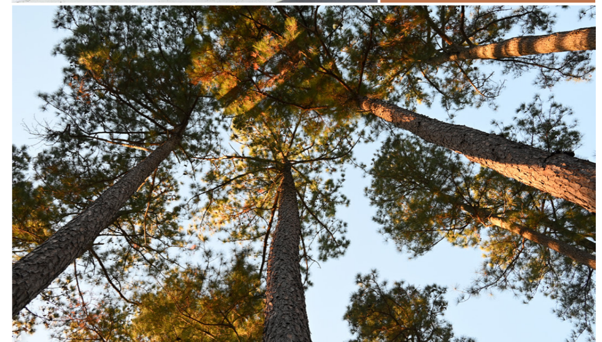
1. Zoom sur le veinage et la teinte du Red Cedar / 2. Red Cedar utilisé en bardage / 3. Yellow Pine utilisé en terrasse / 4. Forêt de Yellow Pine

Le Yellow Pine est préconisé pour les menuiseries intérieures. En extérieur, une préservation Classe 4 est recommandée. Pour conserver la teinte originelle du Red Cedar appliquez un saturateur.